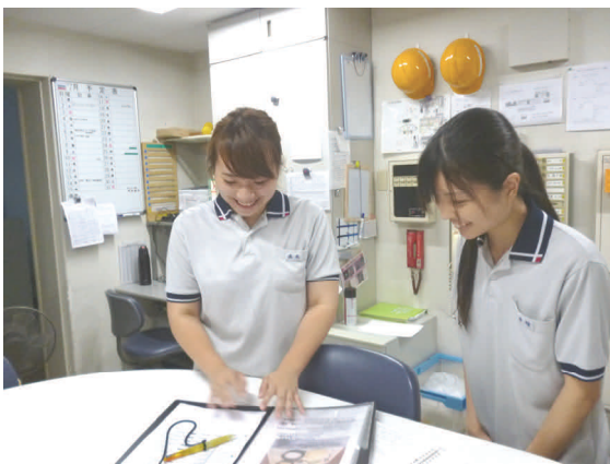
サービスステーションで新人職員と